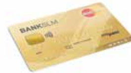
World MasterCard® Silber/